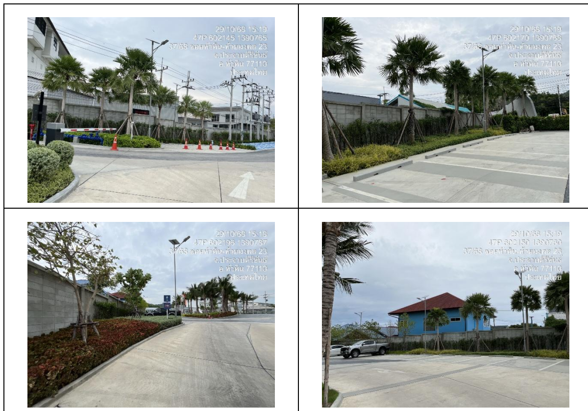
รูปที่ 1 จัดทำรั้วคอนกรีตถาวร รอบพื้นที่โครงการ

ระหว่างเดือนกรกฎาคม ถึงเดือนธันวาคม พ.ศ. 2568