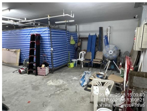
รูปที่ 6 การจัดเก็บวัสดุ/อุปกรณ์ก่อสร้าง และพื้นที่กองเก็บเศษวัสดุก่อสร้าง