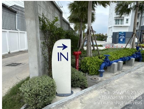
รูปที่ 5 ลูกศรทางเข้า-ออก โครงการ