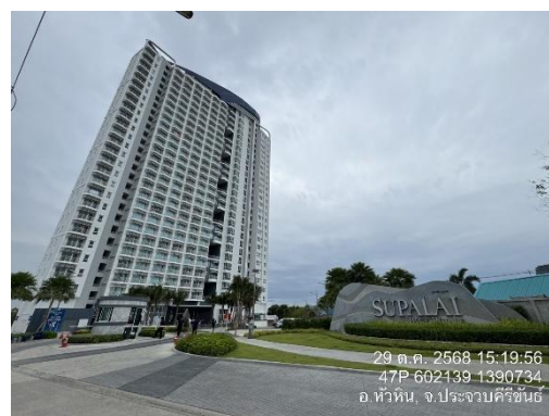
รูปที่ 8 ป้ายโครงการ