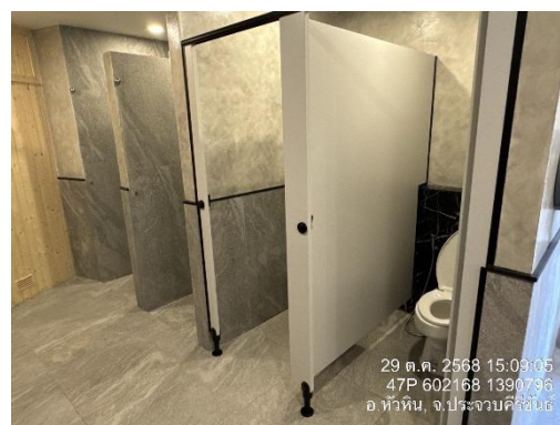
รูปที่ 9 ห้องน้ำ/ห้องส้วม