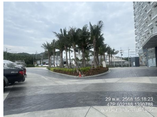
รูปที่ 4 ถนนภายในโครงการ