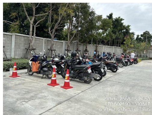
รูปที่ 7 พื้นที่จอดรถ