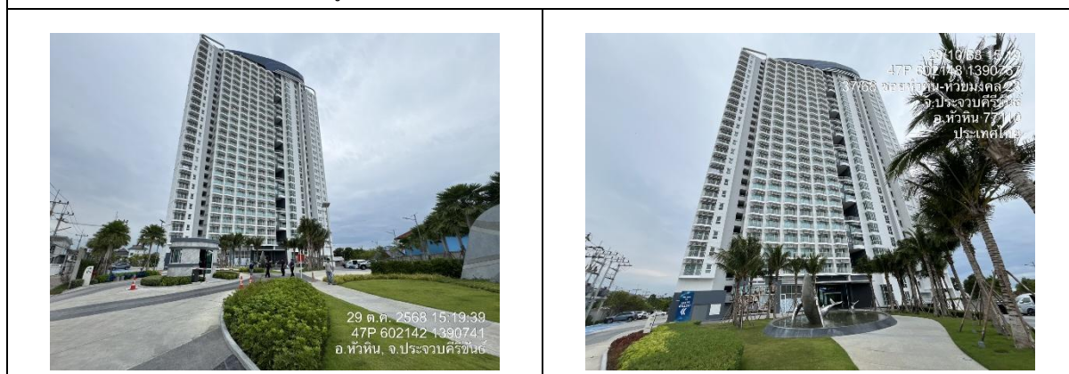
รูปที่ 2 สภาพโครงการ